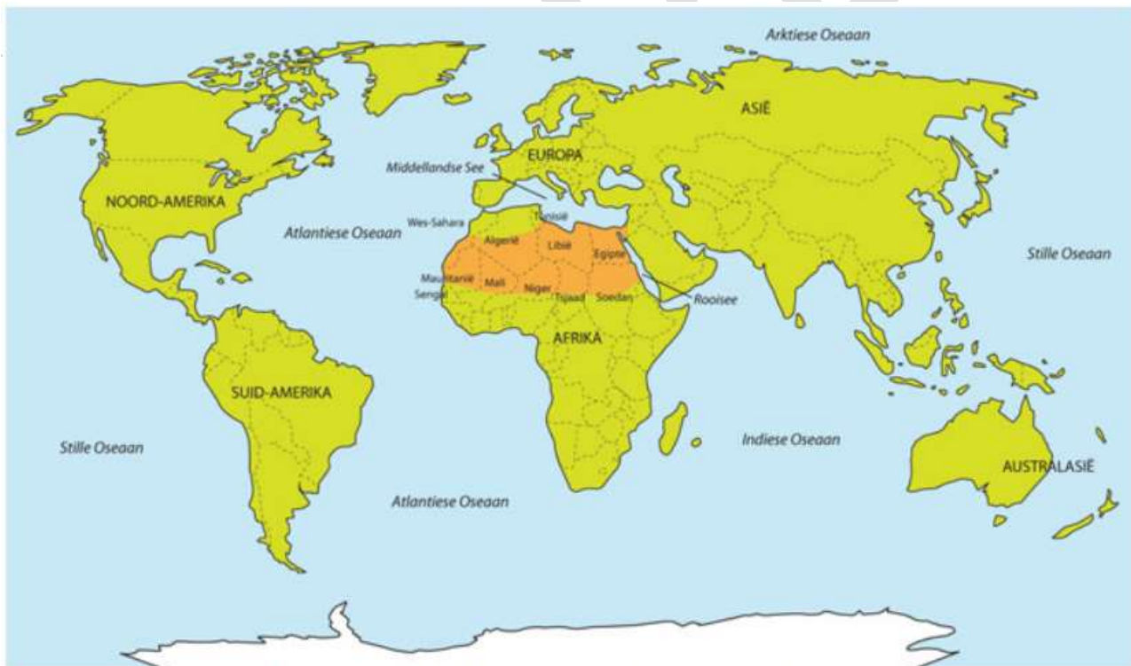
Wêreldkaart wat die ligging van die Saharawoestyn aandui